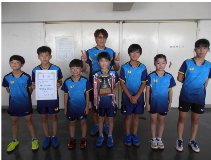
優勝 柏崎クラブスポーツ少年団A