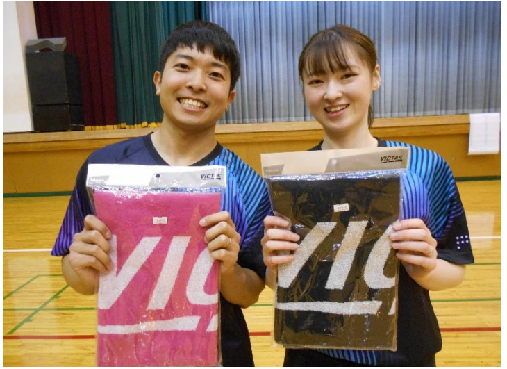
クラス2 優勝 たべっ子どうぶつ